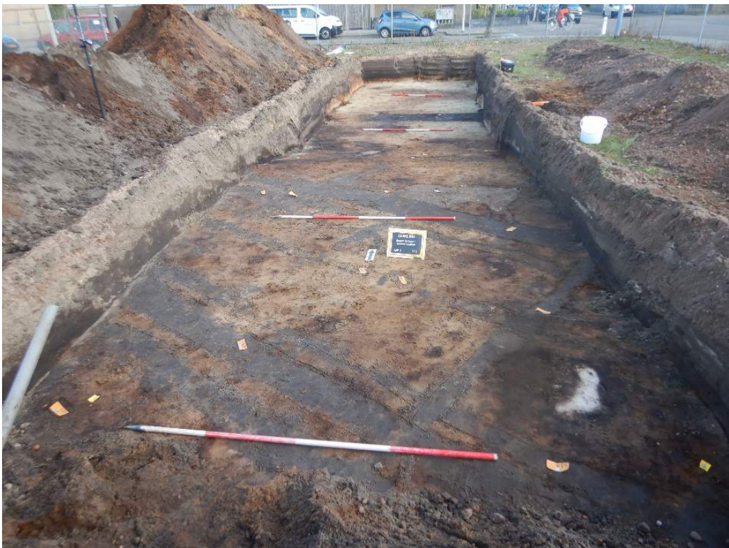
De tweede sleuf met ploegsporen