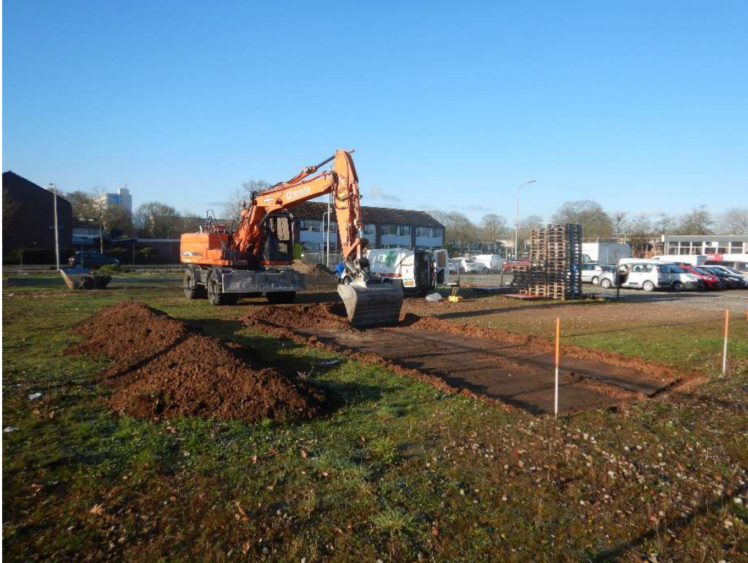
Het aanleggen van de eerste sleuf